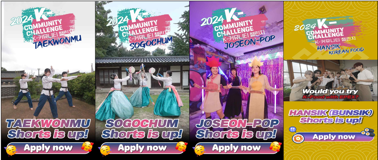
2024년도 K-커뮤니티 챌린지 과목별 숏폼 챌린지 이미지 좌측부터 태권무, 소고춤, 조선팝, 한식

견인하기를 기대한다. 뿐만 아니라 누구나 쉽게 따라 할 수 있는 ‘짧은 영상(숏폼) 챌린지’를 통해 더 많은 관심과 홍보를 하고자 한다.