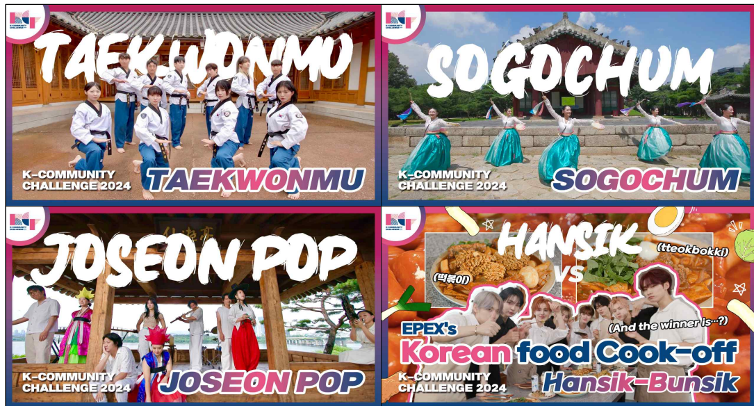
2024년도 K-커뮤니티 챌린지 과목별 시연영상 이미지 좌측상단부터 태권무, 소고춤, 조선팝, 한식

‘2024 K-커뮤니티 챌린지’는 ▲조선팝, ▲소고춤, ▲태권무, ▲한식 4개 부문으로 공모전을 진행한다. 특히 많은 한류 팬들의 호응을 이끌어내기 위해 대중문화 아티스트와 전문가가 직접 참여한 한국문화 강습 영상이 제공된다. 대중문화 아티스트로는 △에스에프나인(SF9), △베베(BEBE), △이펙스(EPEX)가 참여하고 분야별 전문가(예술인)로는 △악단광칠(조선팝), △태권크리(태권무), △비슬무용단(소고춤)이 함께 했다. 강습 영상은 외국인들이 자연스럽게 한국문화의 매력을 느낄 수 있도록 선정릉, 남산공원, 김포 한옥마을, 선유도 공원 등 전통과 현대를 아우르는 한국의 여러 장소를 배경으로 촬영했다.