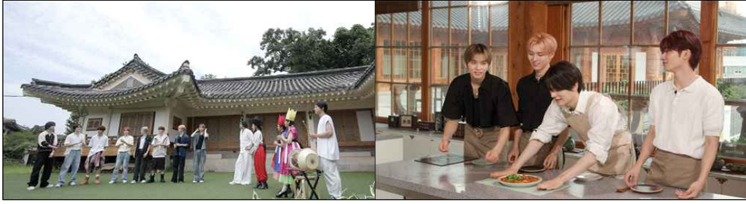
좌측상단부터 태권무 부문 에스에프나인(SF9), 소고춤 부문 베베(BEBE) 조선팝과 한식 부문의 이펙스(EPEX)

‘2024 K-커뮤니티 챌린지’는 ▲조선팝, ▲소고춤, ▲태권무, ▲한식 4개 부문으로 공모전을 진행한다. 특히 많은 한류 팬들의 호응을 이끌어내기 위해 대중문화 아티스트와 전문가가 직접 참여한 한국문화 강습 영상이 제공된다. 대중문화 아티스트로는 △에스에프나인(SF9), △베베(BEBE), △이펙스(EPEX)가 참여하고 분야별 전문가(예술인)로는 △악단광칠(조선팝), △태권크리(태권무), △비슬무용단(소고춤)이 함께 했다. 강습 영상은 외국인들이 자연스럽게 한국문화의 매력을 느낄 수 있도록 선정릉, 남산공원, 김포 한옥마을, 선유도 공원 등 전통과 현대를 아우르는 한국의 여러 장소를 배경으로 촬영했다.