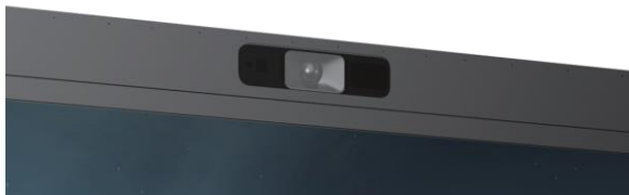
AI탑재 3카메라 어레이 & 15마이크 어레이