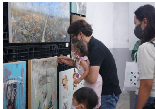
작품에 점찍기 : 자신이 가장 좋아하는 작품 1점에 투표하는 컬렉터 교육 프로그램