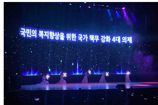
▲제19회 사회복지사의날 기념식 및 전국대회 기념공연