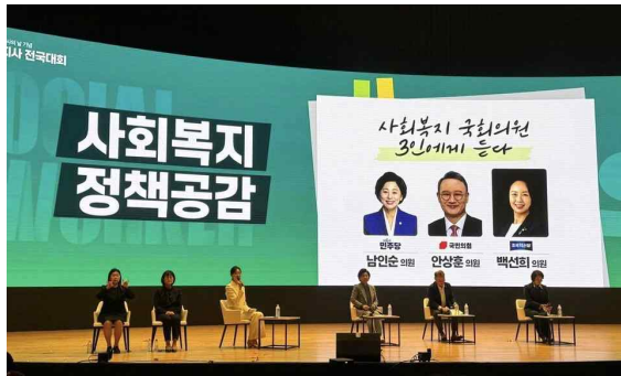
▲사회복지 정책공감 진행 모습