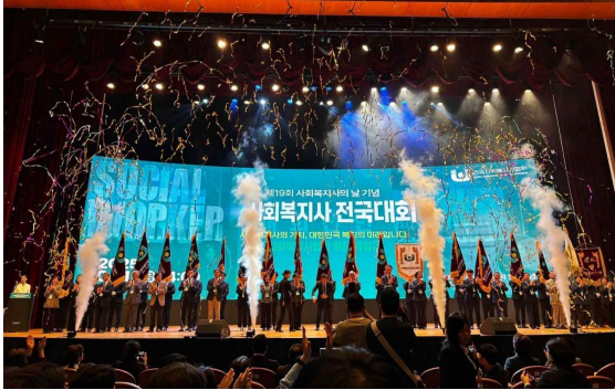
▲17개 시도협회 및 3개 산하단체장이 함께 한 입장식