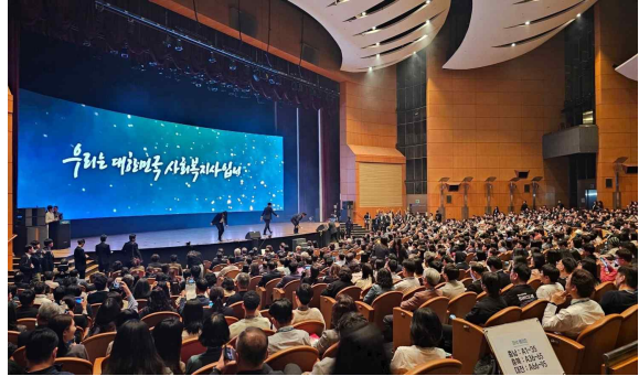
▲제19회 사회복지사의날 기념식 및 전국대회에 참여한 전국의 사회복지사