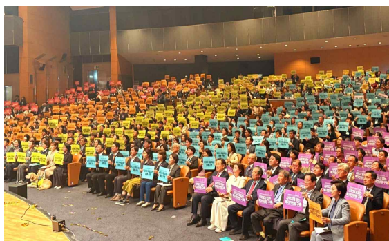
▲제19회 사회복지사의 날 기념 ‘사회복지사전국대회’에 참여하여 피켓을 들고 있는 사회복지사